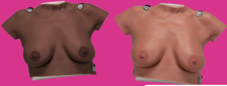
BUSTES EN SILICONE

Ces bustes en silicone disposent de 7 anomalies symptomatiques du cancer du sein (grosseurs, rétraction mamelonnaire, épaissement de la peau). Ils permettent de saisir l'importance d'un examen visuel et tactile de la poitrine. Leurs différentes couleurs de peau permet également une plus grande inclusivité des ateliers.