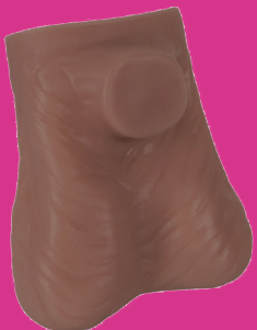
MODÈLE DE TESTICULE

Les coupes anatomiques permettent de comprendre ce qu'il y a dans la poitrine, la glande mammaire, les muscles etc. Cela permet également de replacer la poitrine comme organes à part entière et de la déssexualiser.